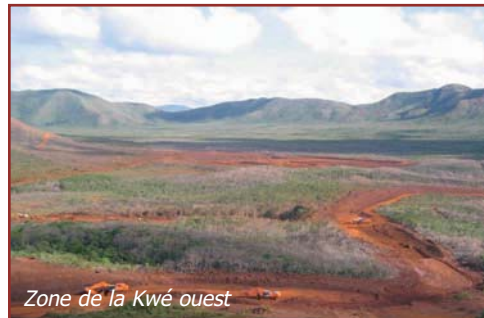
Zone de la Kwé ouest

La zone de stockage des résidus miniers de la première phase est située entre le col de l'Antenne et la carrière du Mamelon, dans la haute vallée de la Kwé ouest.