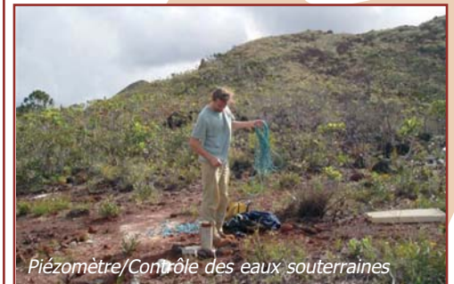
Piezomètre/Contrôle des eaux souterraines

Les eaux souterraines seront soumises à des contrôles stricts et réguliers via un réseau dense de piézomètres (puits d'échantillonnages) disposés autour des zones de stockage. Si un problème devait être détecté, un système de pompage dans un réseau de drain filtrant (réseau de puits) en aval du stockage permettrait d'éviter toute contamination en recyclant les eaux minéralisées vers l'usine pour traitement.